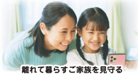
離れて暮らすご家族を見守る